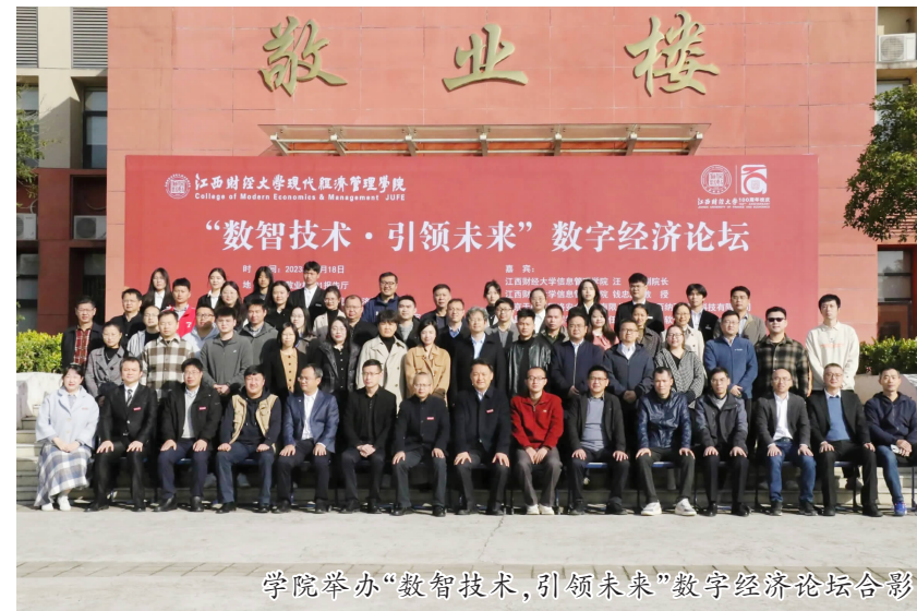
学院举办“数智技术·引领未来”数字经济论坛合影