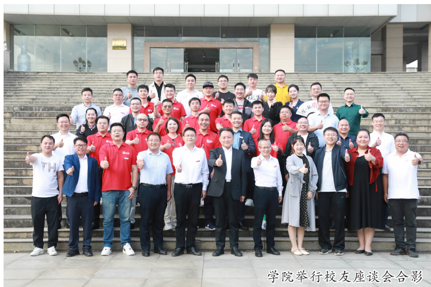
学院举行校友座谈会合影