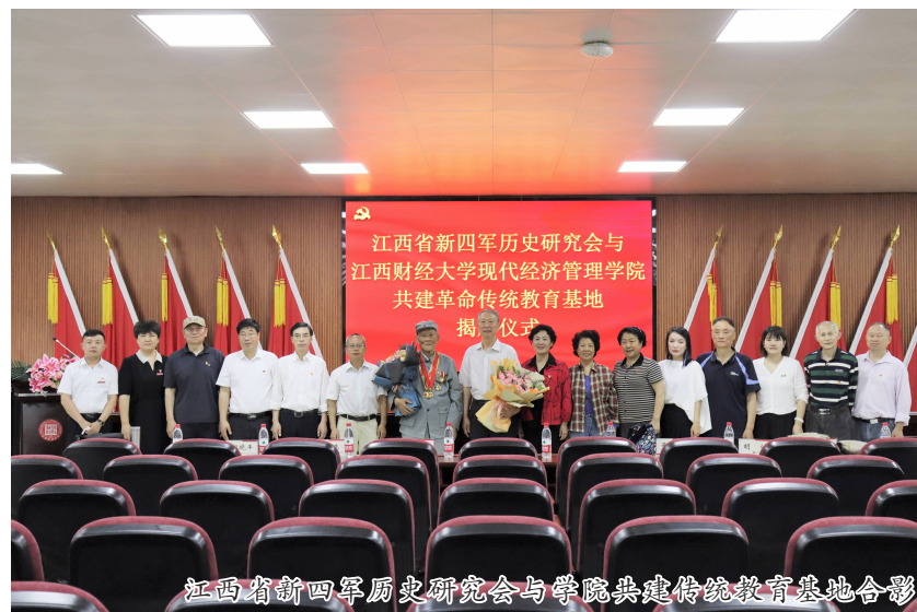
江西省新四军历史研究会与学院共建传统教育基地合影