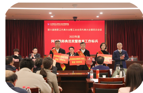
2022年度阿贝恩师范奖暨教育工作标兵